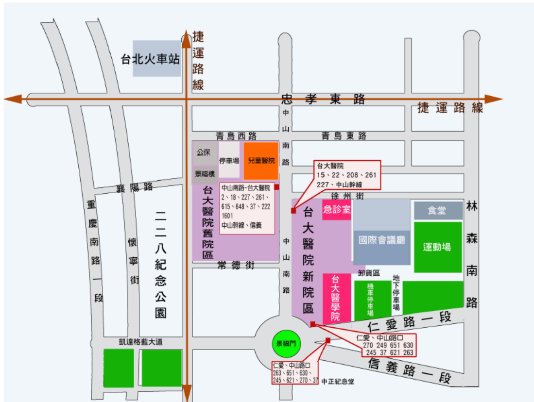
台大醫學院交通路線圖