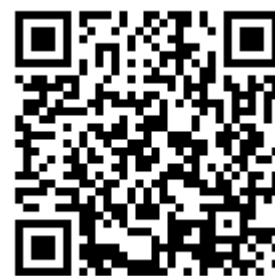
海報比賽公告 QR CODE