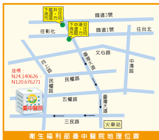
衛生福利部臺中醫院地理位置

(二) 台東馬偕紀念醫院 交通指引： https://ttw3.mmh.org.tw/webpage.php?id=40