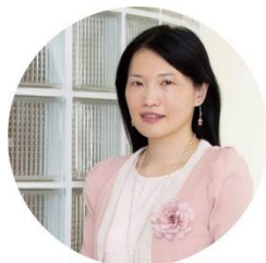
童恆新理事長 台灣專科護理師學會理事長 國立陽明交通大學護理學系 系主任暨特聘教授