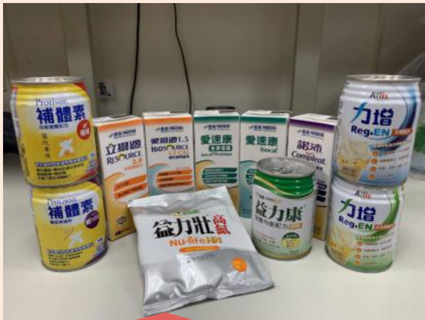
各類聚合、疾病配方