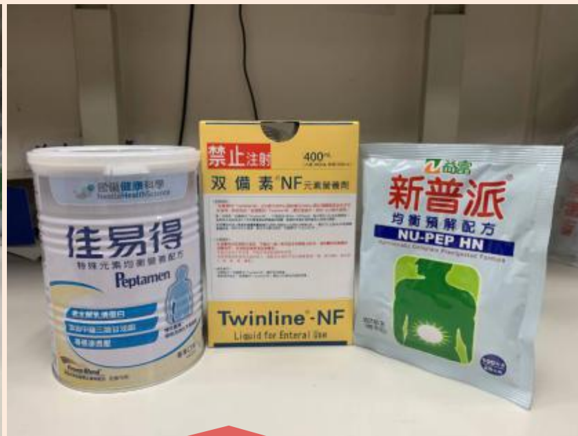
各類預解元素配方