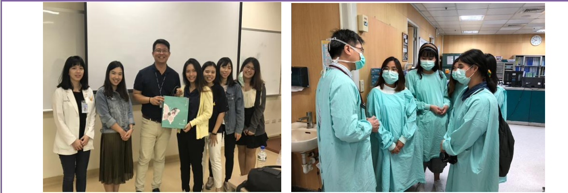
泰國洽朱隆功大學參訪