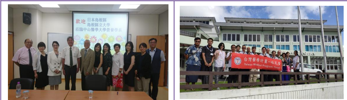
日本島根大學參訪