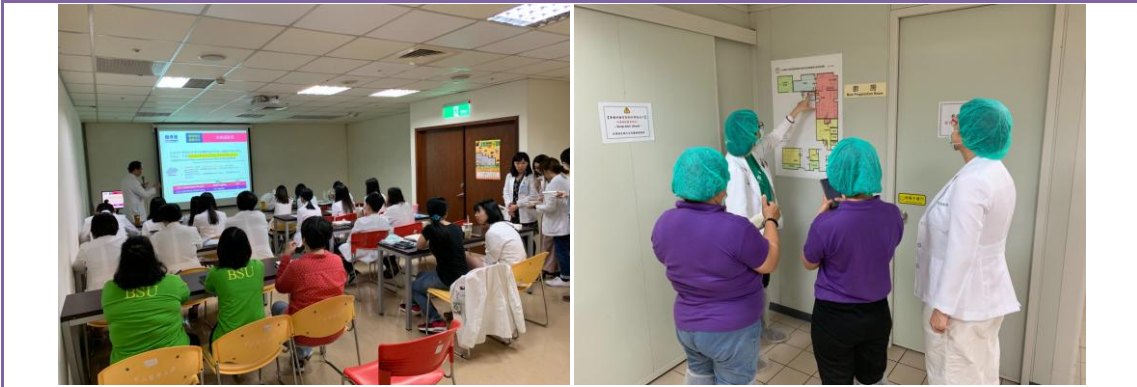
菲律賓格特省大學參訪

我們與全球各大學合作提供參訪包括：菲律賓格特省大學、日本島根大學、泰國洽朱隆功大學及中山醫學大學健康餐飲暨產業管理學系，輔導學校相關科系同學實地見習以教學相長。並提供中國蒸焗燴食品集團參觀了解本院廚房之設置、各項餐食設計及供餐流程等。亦配合「中山醫學大學附設醫院國際醫療中心」執行外交部之吐瓦魯台灣醫療計畫派任營養師前往進行營養及衛生安全相關教育訓練。