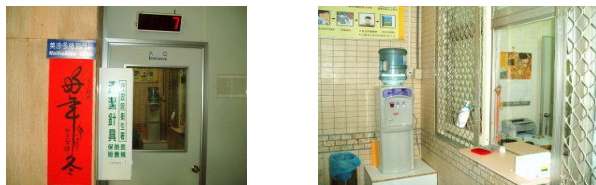
中山醫學大學附設醫院美沙冬門診照片